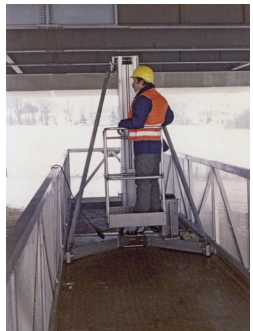
Steuerung im Korb