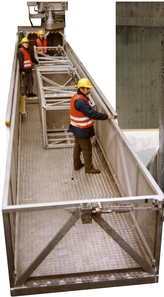
Teleskopgerüst 2,5 bis 6,5 m Arbeitshöhe